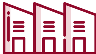
Naves industriais e comerciais